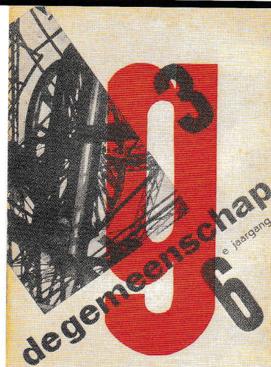
Omslag van van De Gemeenschap van maart 1930, ontworpen door Paul Schuitema, een voorbeeld van de stromingen Nieuwe Typografie en Nieuwe Fotografie.

verse literatuur- en kunstcritici, met name in de eerste tien jaar van zijn bestaan, gezien als een interessant voorbeeld van een tijdschrift dat de modernistische stromingen in de kunst en in de literatuur van de jaren twintig een gezicht wil geven. Het blad is, naast de tijdschriften De Stijl en Wendingen , van groot belang geweest voor het modernisme in Nederland in de periode 1925-1934. ●